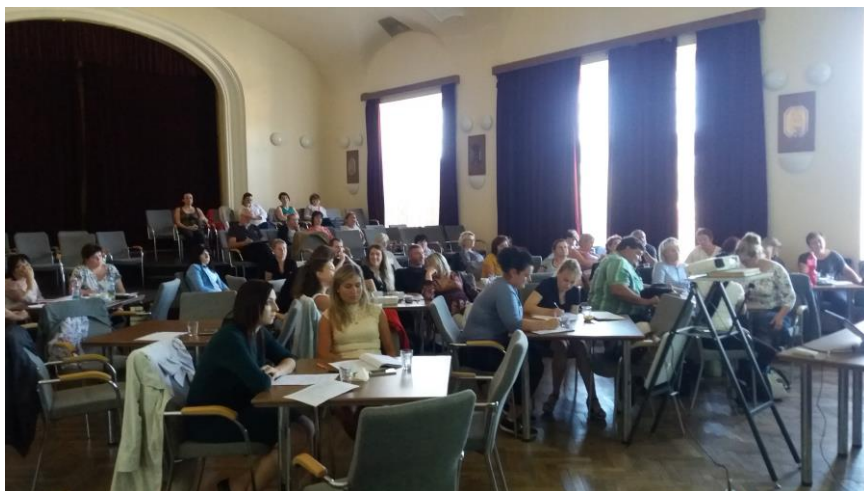
Školení „Zákon č. 128/2000 Sb., o obcích.

Pro veliký úspěch a na základě poptávky po dalších školeních se v březnu tohoto roku budou moci obce zúčastnit školení na témata „Jednání a usnášení orgánů obcí“ a „Právní minimum starosty“. Obě školení povede opět JUDr. Kubánek.