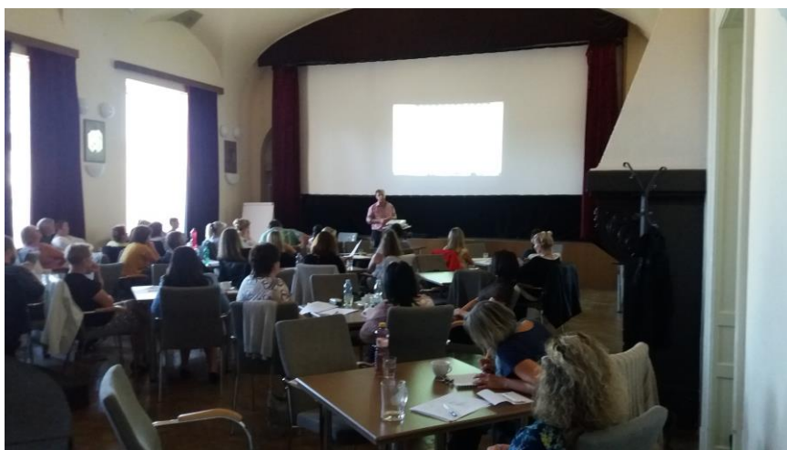
Školení „Zákon č. 128/2000 Sb., o obcích.