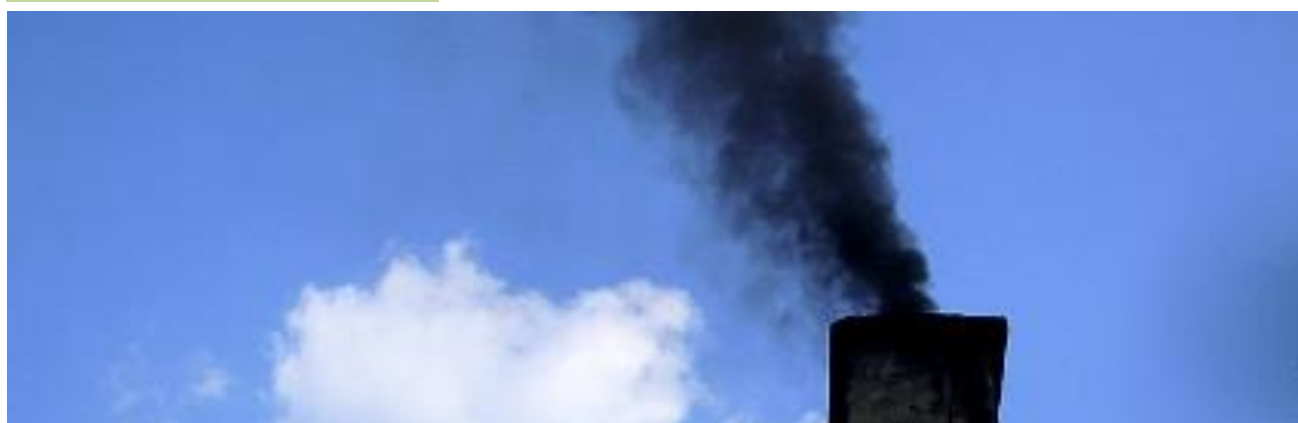
Ilustrativní foto.