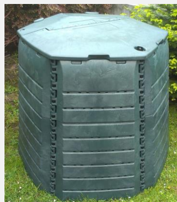
Ilustrativní foto.

Kompostéry budou rozmístěny v obcích: Bocanovice, Bukovec, Bystřice, Dolní Lomná, Hrádek, Jablunkov, Košařiska, Milíkov, Mosty u Jablunkova, Návší, Nýdek a Písečná.