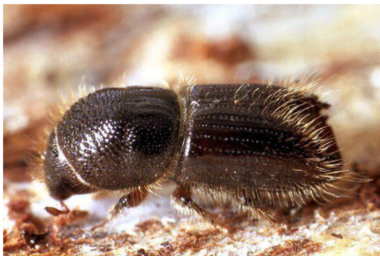
Ilustrativní foto.

Zdravotní stav nejrozšířenější dřeviny našich lesů - smrku je již delší dobu velice špatný. Příčiny jeho chřadnutí je potřeba hledat ve změně klimatických podmínek za posledních 10–15 let. Zejména opakující se periody sucha svědčí obyčejné houbě václavce smrkové. Ta se dnes pro smrk stala doslova pohromou. Kdysi neškodná houba je dnes tzv. spouštěčem chřadnutí smrku, což se projevuje jeho postupným vadnutím vedoucím až k odumření celého stromu. Od fáze napadnutí kořenového systému smrku václavkou až po jeho odumření může uběhnout různě dlouhá doba, a to od několika měsíců až po několik roků. Jakmile strom začne pomalu vadnout, je to ideální šance pro kůrovce , který v takto oslabeném stromě cítí ideální příležitost k dalšímu rozmnožování. A právě toho jsme dnes v našem okolí svědky. Ten, kdo pravidelně navštěvuje zdejší lesy, si určitě všimne, že už cca 3 poslední roky stoupá intenzita těžeb právě oněch kůrovcových stromů. Dnes mluvíme o silné kůrovcové gradaci . Musím zde podotknout, že s touto situací nebojují lesníci jen na Jablunkovsku, ale kůrovcová kalamita zasáhla už i Jesenicko, Bruntálsko, Olomoucko a bohužel šíří se dál západním směrem. Nikdo dnes nemůže a neumí říci, kdy kalamita skončí.