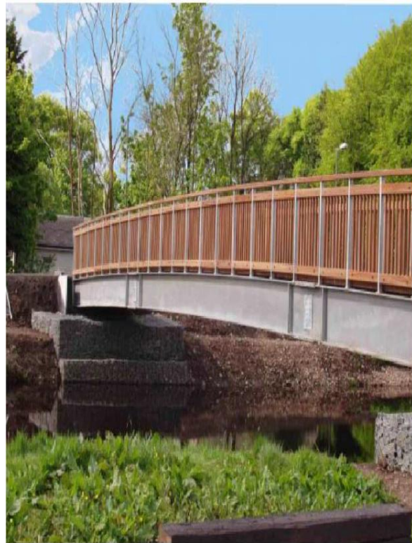
Ilustrativní obrázek plánované lávky

Sdružení obcí Jablunkovska má ambice pokračovat v rozvoji a budování cyklistických stezek napříč celým mikroregionem a stávající doplňovat doprovodnou infrastrukturou, jako jsou stojany či boxy na kola, půjčovny kol, elektrokol, odpočívky apod.