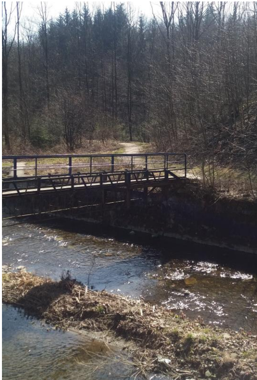
Současná lávka přes řeku