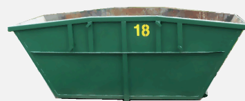
Ilustrativní foto.

Celkem bude v rámci projektu zakoupeno 6 ks kontejnerů: 3 ks o objemu 15 m 3 a 3 ks o objemu 30 m 3 . Každá ze zapojených obcí obdrží 2 ks kontejnerů, od každé velikosti jeden.