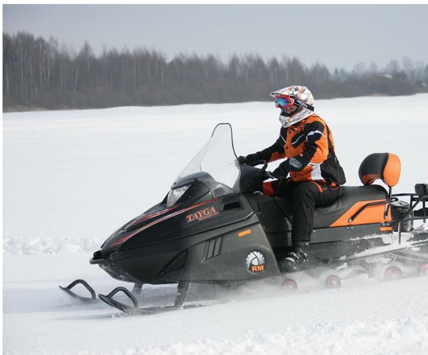
Ilustrativní fotografie

Součástí projektu je také zakoupení sání, pomocí kterých bude zajištěna první pomoc zraněným běžkařům či lyžařům a jejich svoz k místu dojezdu záchranné služby.