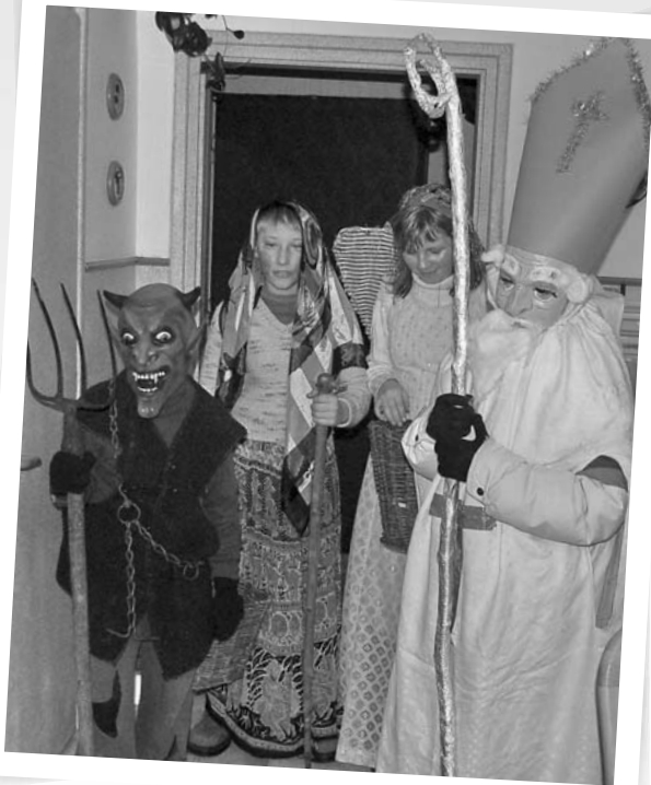
Mikuláš se svou družinou opět naděloval. Hlásil, že letos mu zdražili ublí i brambory, tak to bude řešit poblavkem.