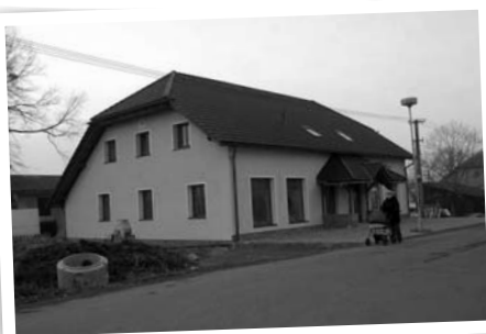
Takto vypadá dnes