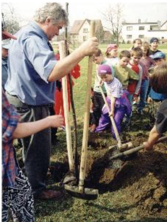
Sázení „stromu 3. tisíciletí“

V závěru jsme se přesunuli před obecní úřad, kde za aktivní účasti starosty a ředitelky české školy proběhlo zasazení mladé lípy, symbolizující změnu tisíciletí. Paní ředitelka popřála lípě zdárný vývoj. Tečkou této pohodové události byla píseň o vlasti, kterou jsme všichni spontánně zapěli. (RB)