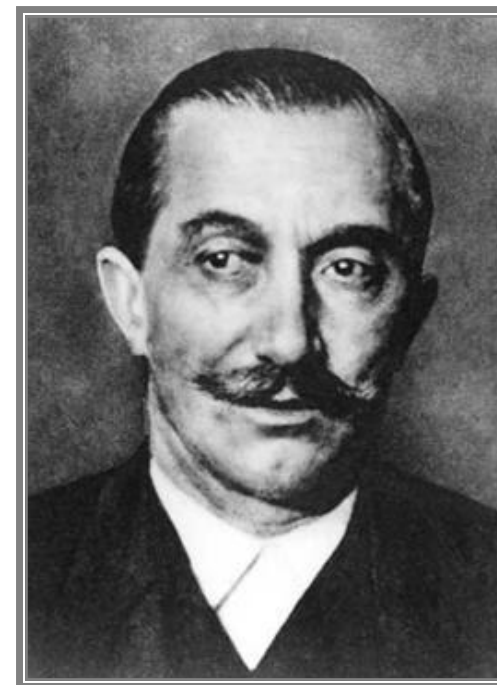
Pramen : wielka encyklopedia internetowa (RB)

Współpracował z emigracyjnym ugrupowaniem antysanacyjnym Front Morges (1936). W marcu 1939 powrócił do kraju, we wrześniu 1939 uwięziony przez Niemców i nakłaniany do utworzenia rządu kolaboracyjnego, odrzucił propozycję. Zwolniony z więzienia w 1941, przebywał w areszcie domowym pod stałym nadzorem gestapo. 1945 wybrany na prezidenta Krajowej Rady Narodowej, nie podjął obowiązków. Nie skorzystał także z zaproszenia do wzięcia udziału w rozmowach moskiewskich w sprawie utworzenia Tymczasowego Rządu Jedności Narodowej. Od sierpnia 1945 prezes PSL.