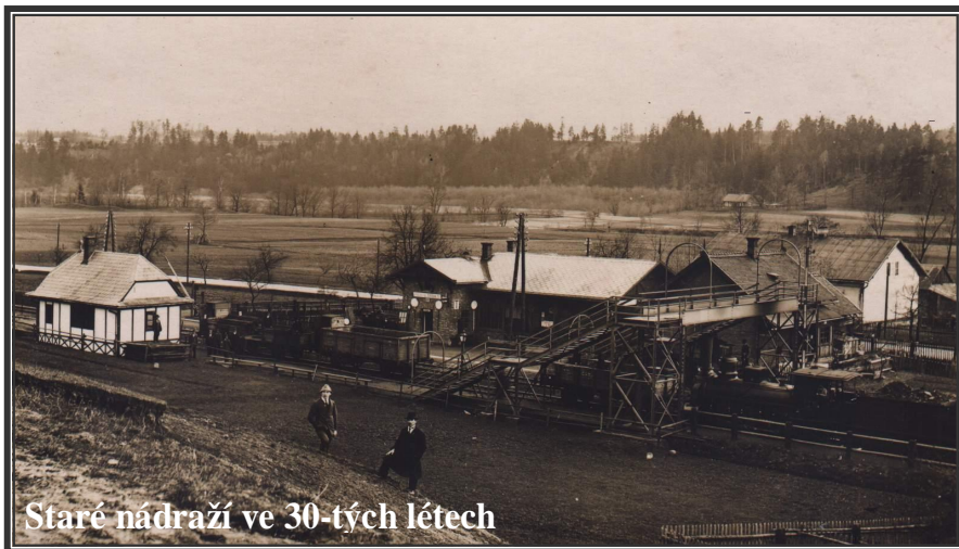
Staré nádraží ve 30-tých létech

První střípek je v podobě několika unikátních fotografií Hrádku, jejichž kopie jsem získal od paní Kaletové , které tímto co nejsrdečněji děkuji. Tady je jedna z nich: