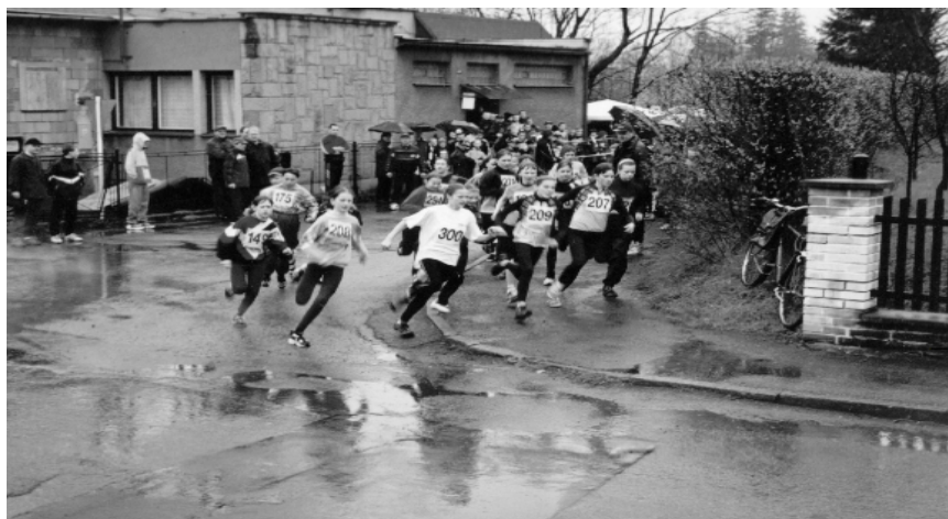
Po startu kategorie dívky roční 1988 - 1989