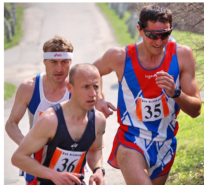
Vítězné trio letošního ročníku