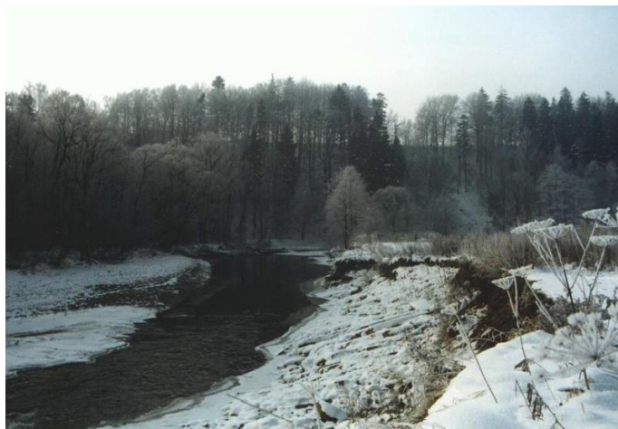
Olza v zimě