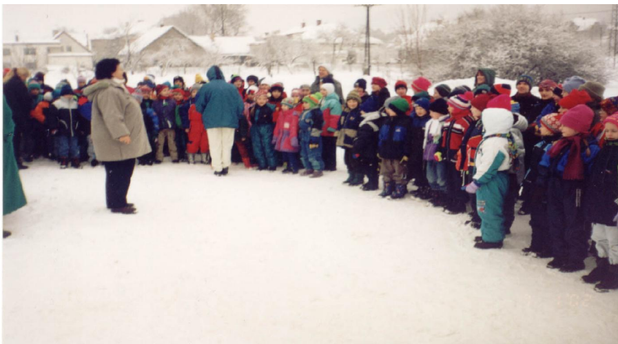
Tříkrálové zpívání před budovou Obecního úřadu - 4. 1. 2002